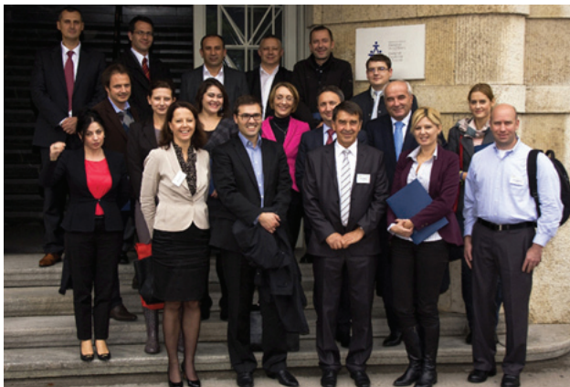
Pjesëmarrësit e tryezës së diskutimit

Qendra e Ekselencës Financiare e Sllovenisë në bashkëpunim me Agjencinë e Mbikëqyrjes në Sigurime të Sllovenisë organizuan në 10-11 tetor në Ljubjanë, Slloveni një tryezë diskutimi mbi zbulimin dhe parandalimin e mashtrimeve në sigurime me pjesëmarrjen e përfaqësuesve nga autoritetet rregullatore të vendeve të Ballkanit